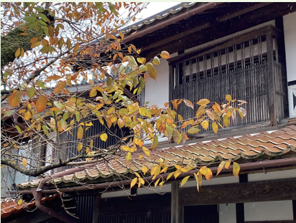
新庄村のがいせん桜通りの作樂も・・秋色