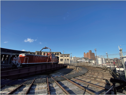
2021 年秋、津山まなびの鉄道館にて。転車台。