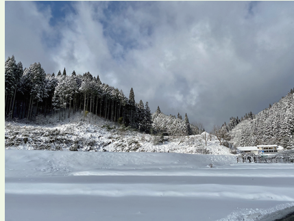
そして 12 月に入ると降雪の新庄村。