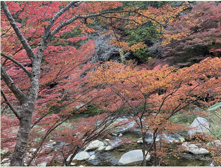
2021 年晩秋に家族で鏡野町の奥津溪に。