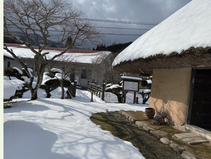
大晦日は新庄村産のお蕎麦で。